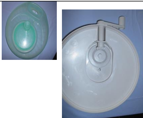
Desessoreuses à salade