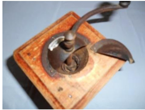
Un moulin à café ou à poivre