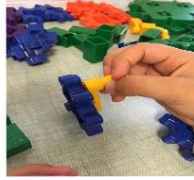
Ne tourne pas