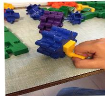
Ne tourne pas