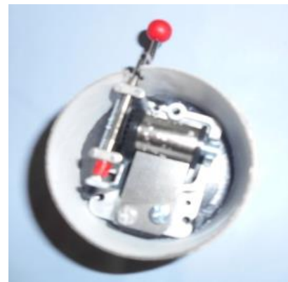
Une boîte à musique