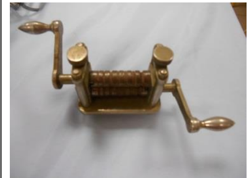
Un laminoir de bijoutier