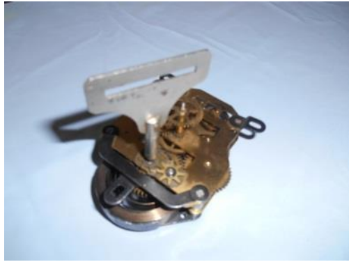
Un mécanisme de réveil

On a demandé aux parents de nous aider à trouver des objets utilisant les engrenages.