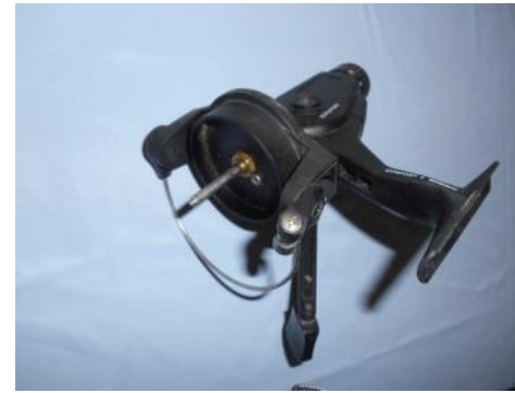
Un moulinet de pêche