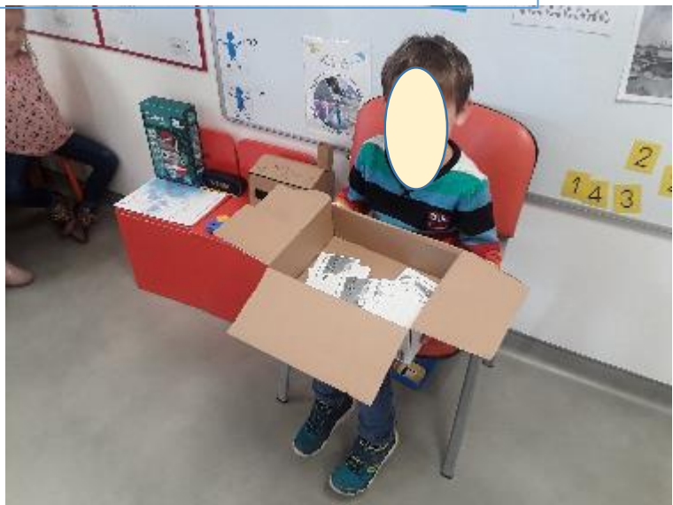
Vote en spectateur éclairé