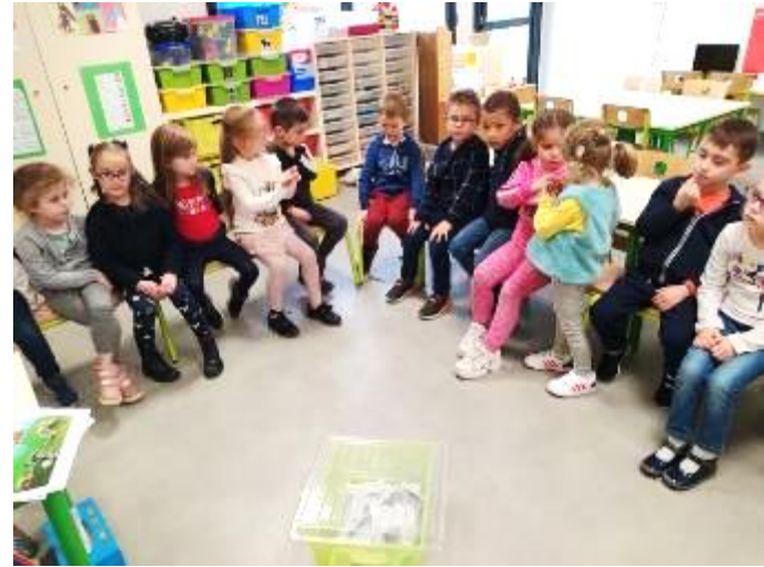
Votes après échanges ,argumentation