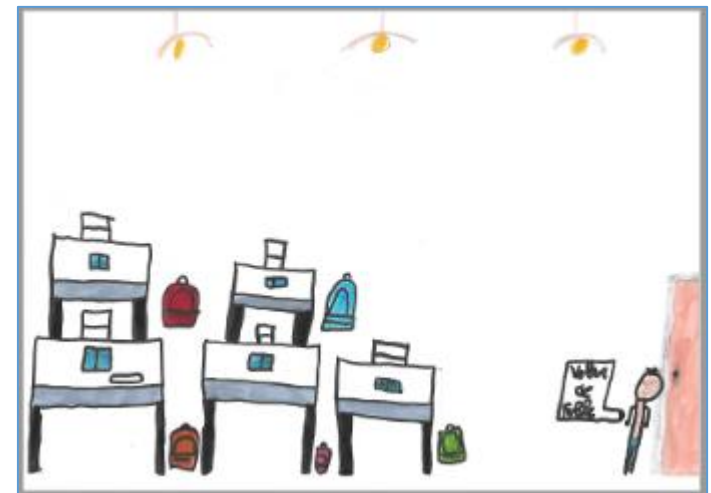
Une journée particulière