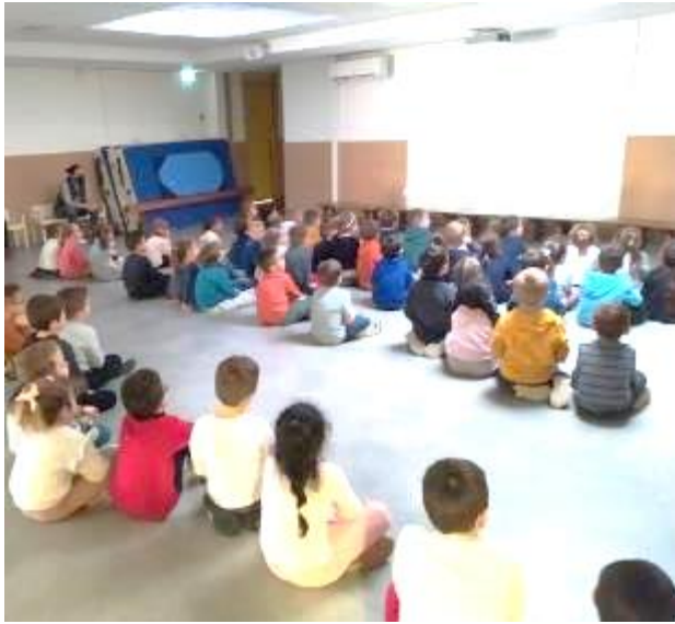
Visionnage des films