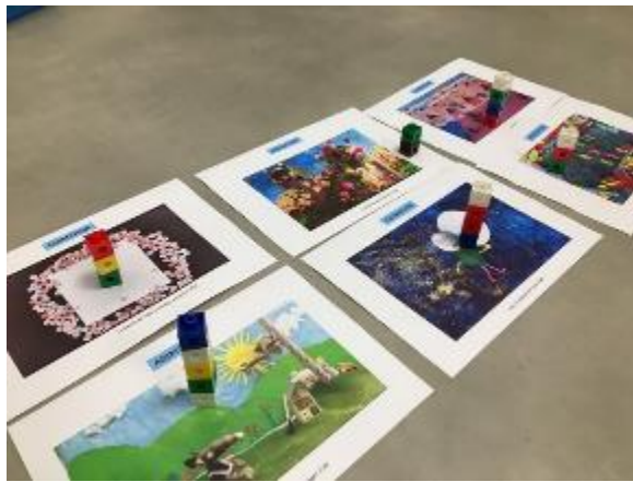
Vote des MS avec des cubes et comparaisons de la hauteur des tours.