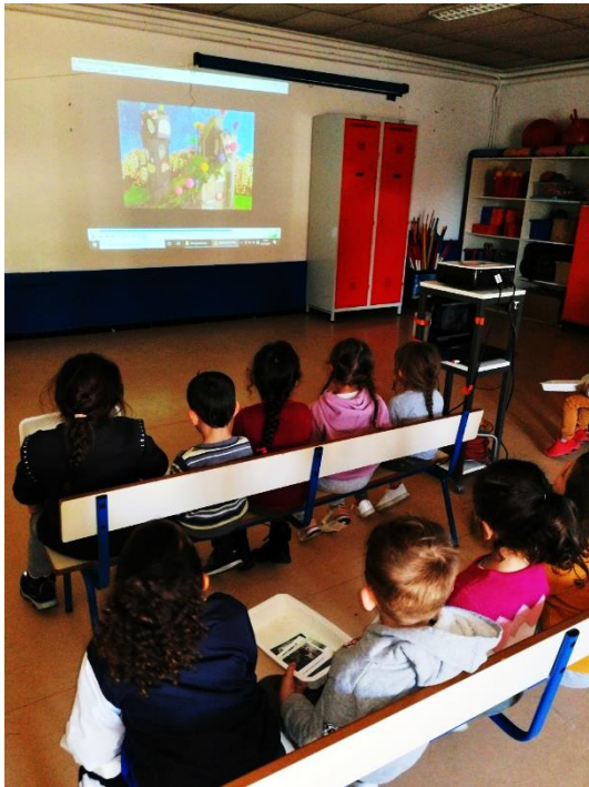
Visionnage des films