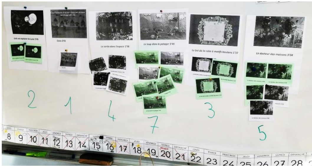
Confrontation vote personnel et votes de la classe