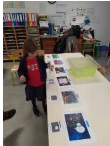
Vote des GS avec des bulletins.