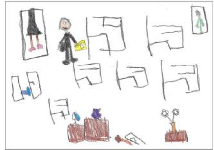
Une journée particulière