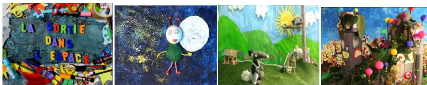
La sortie dans l'espace Lulu va explorer la lune Le loup dans le potager Le docteur des maisons

Depuis le retour des vacances, nous avons commencé l'étude des films pour la participation au jury grand écran. Nous avons travaillé sur 4 films.