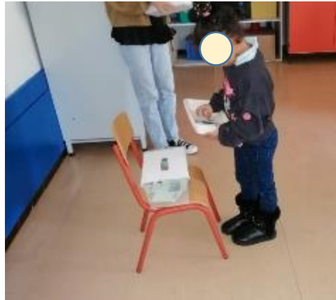
Choisir et voter en spectateur éclairé