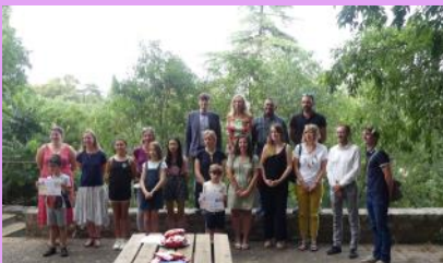
Lauréats GRAND ÉCRAN 2021 Remise des Prix MAIF

Projection en avant –première des films lauréats à Canopé le 29 juin :