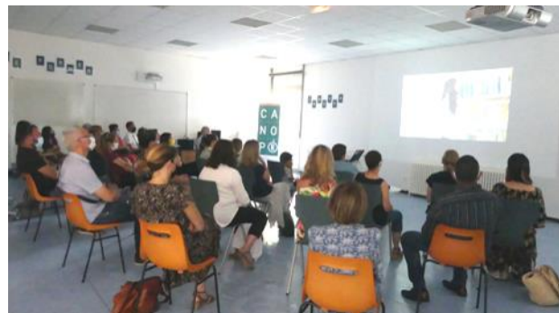
Projection des films GRAND ECRAN