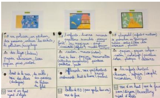
Outils pour les classes, démarche pour construire le regard