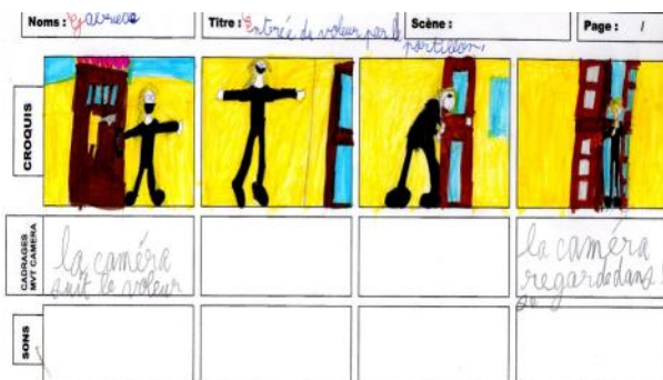
Storyboard film en vue réelle « Une journée particulière » Ecole élémentaire St Chaptès