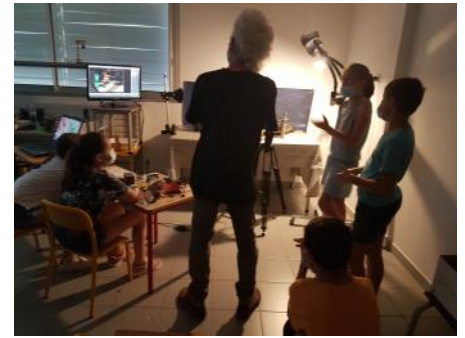
« Terreur à Montparnasse » Ecole élémentaire Caveirac

Lien vers témoignage réalisation du film