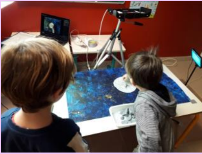
« Lulu va explorer la Lune » Ecole maternelle La Gazelle Nîmes

BOITES à IMAGES : Projet départemental cinéma « Des artistes et des œuvres à l'école » SE LANCER DANS LA RÉALISATION D'UN FILM AVEC SES ÉLÈVES : possibilité d'un financement DSDEN/DRAC pour intervention d'un professionnel du cinéma en classe et réaliser un court métrage animation ou prise de vues réelles : appel à projet en juin et dépôt des can-