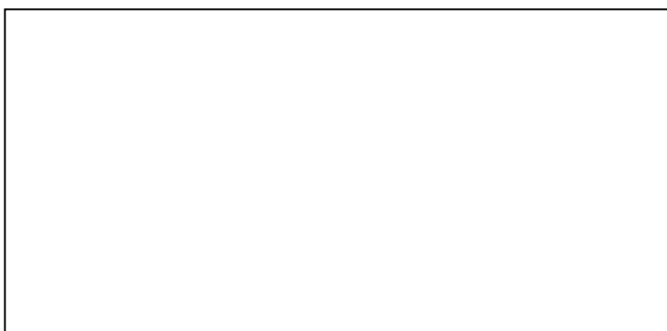
Dessin de l'extrait