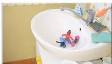
Un voyage inattendu