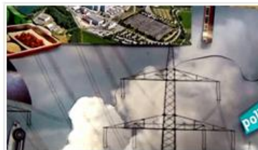
Le coeur infini de la Terre