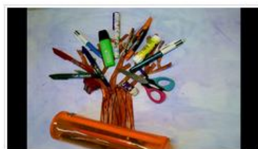
Un arbre comme nous