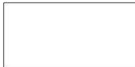
Dessin de l'extrait