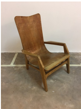
1 ère réalisation en 1952

1950-1985 : Nombreuses commandes d'aménagements pour des magasins et des stands de salon en architecture d'intérieur. Il s'agit de créer des ambiances, de jouer avec la lumière et de projeter l'usager dans un monde sans temporalité pour l'aider à vivre le moment présent.