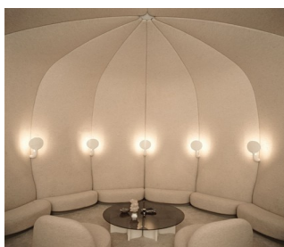
Fumoir à l'Elysée

Organisation du département artisanat ethnographique (repérage et achat des objets dans tous les pays, expositions et ouverture de deux boutiques dédiées à Paris et Montréal). Organisation pour l'ACCT du service de presse et de relations publiques.