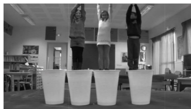
LES PIONNIERS DU CINÉMA Film trucages « Effets de distance » CE2-CM1 Frank Sales, école de Villevielle