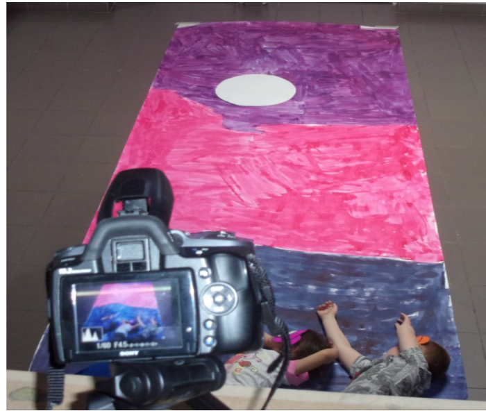
LES CONTES CHINOIS PS-MS- Sylvie Castel, Nicole Pauline Ecole St Génès de Mauguères