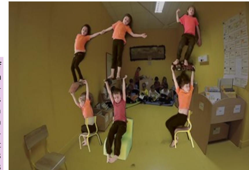
PROJET EUROPEEN ABCINEMA GS Marie Ange Wuathier SAINT-GENIES-DE-MALGOIRES après LES PIONNIERS DU CINEMA « Les acrobates Japonais Kiriki » professionnel Thierry Bourdy