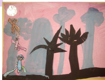
LES CONTES CHINOIS PS-GS de Isabelle MANGOLF, école M.Long, Nîmes