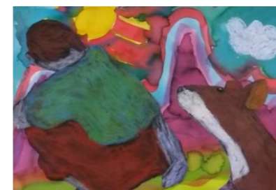
GOSHU LE VIOLONCELLISTE C2 Florence Gil Avèze

Avec la mise en place dans le courant de l'année de la plateforme numérique « NANOUK »,les nouveaux programmes, le parcours d'éducation artistique et culturelle, le numérique de plus en plus présent dans les pratiques sociales, artistiques et scolaires, tout va concourir à questionner les pratiques pédagogiques vers de nouvelles expérimentations de création : pour permettre aux élèves d'imaginer en sons et en images .