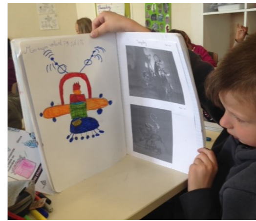
LE DIRIGEABLE VOLÉ CP CE1 de Laurie Picaud Ecole Primaire Villa Clara Pont St Esprit