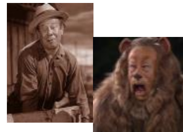
L'ouvrier agricole et le lion peureux