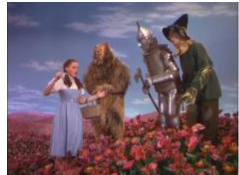
Le champ de fleurs