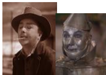
L'ouvrier agricole et l'homme en fer blanc