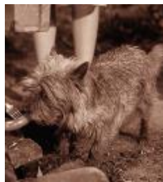
Le chien Toto