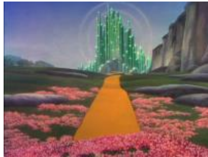
Emeraudeville au loin