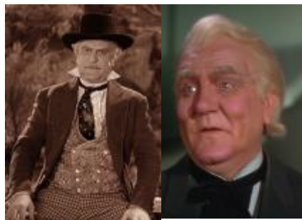
Le professeur Merveille et le magicien d'Oz