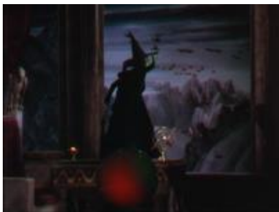
Le palais de sorcière