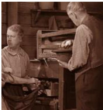
Tante Olympe et l'oncle