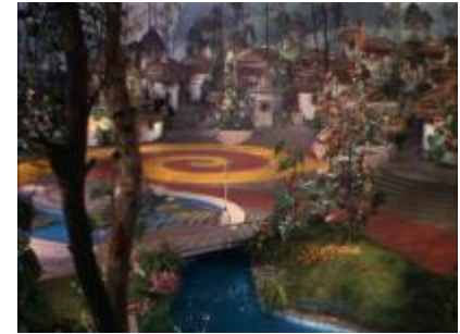
Le pays d'Oz