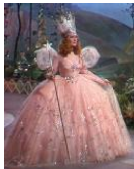
La bonne fée