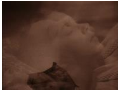
La maison dans la tornade