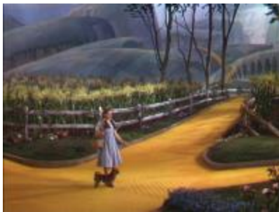
La route aux briques jaunes