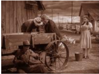
La ferme au Kansas