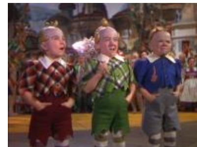
Le peuple des Microsiens