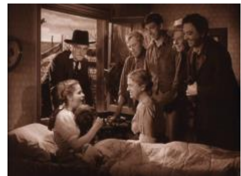
La chambre de Dorothy