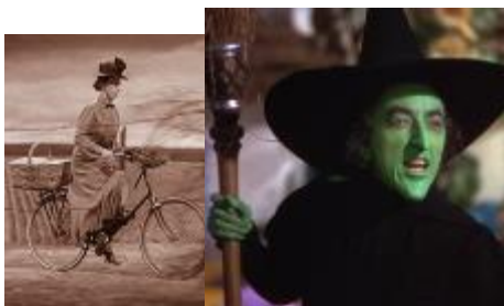
Mlle Gulch et la sorcière