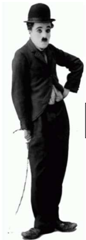
Charlot « alcoolique »