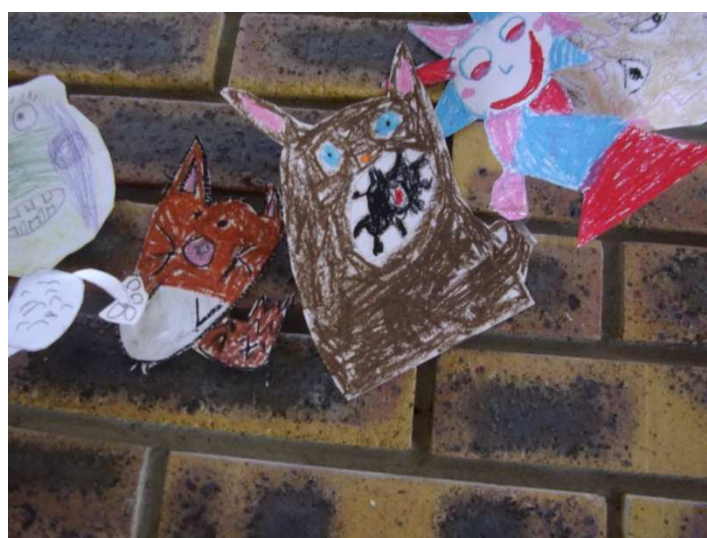
la ronde des Totoros