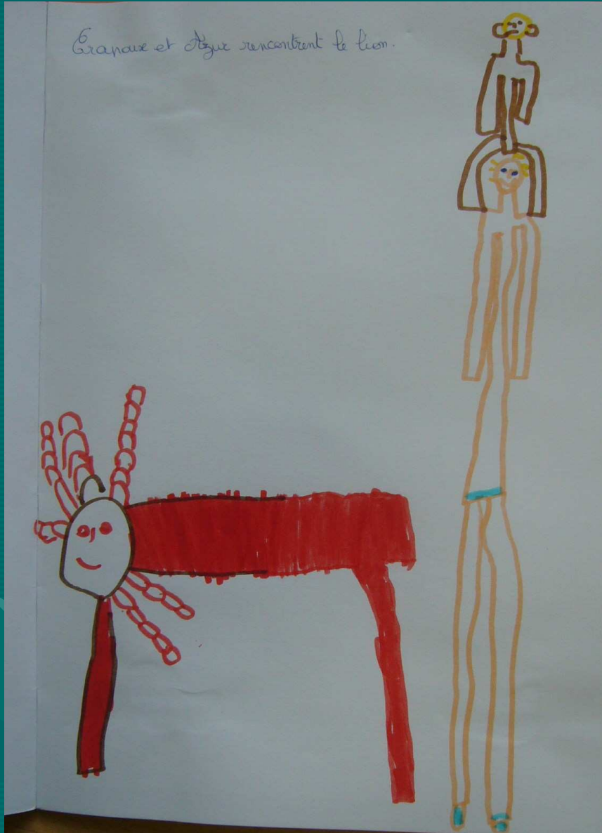
Crapoux et Azmar rencontrent le lion

Après le film : un dessin d'une scène qui t'a marqué .