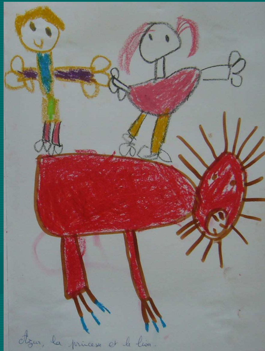
Azur ,les princesses et le lion